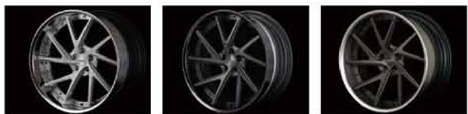
Disk Finish:Brushed Silver(Matte) Rim Finish:High Polish 12Point Stainless Bolt:Chrome Disk Finish:Brushed Anodized Black Rim Finish:Anodized Black(Gloss) 12Point Stainless Bolt:Matte Black Disk Finish:Brushed Bronze Rim Finish:Anodized Bronze 12Point Stainless Bolt:Matte Black

01 スクリューのような回転性が表現されたディスクは、過去にも例があったが、方向を合わせた左右専用デザインは稀少。ローダウンはiDのローリングキットによるもの。 02 近づいてみると造形の複雑さが実感できる。フィニッシュは切削後を演出のツールとして活かしたブラッシュドアナライズドブラック。03 ピアスボルトとホイールボルトはクロム仕様。窓枠のプレミアムアイテムだけに、カラーオプションは豊富に用意されている。